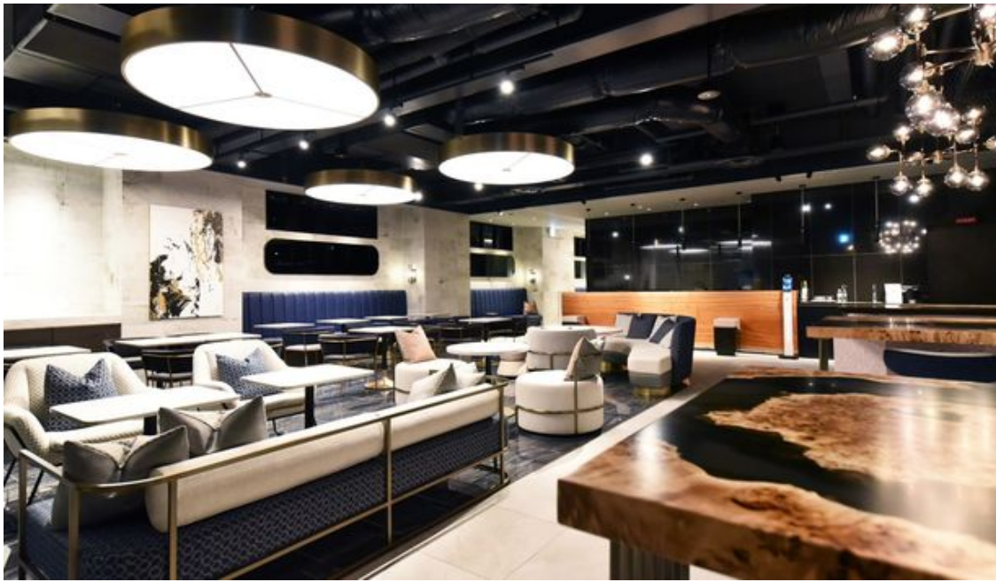
【ロビー&ダイニング】