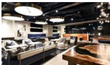
【ロビー&ダイニング】