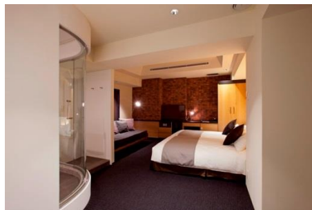
ラギットツイン(1室)