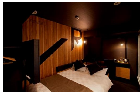
セミダブルルーム(33室)