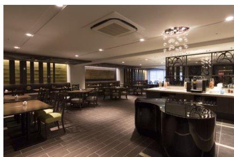
『杜のバッチャ』をイメージしたレストラン